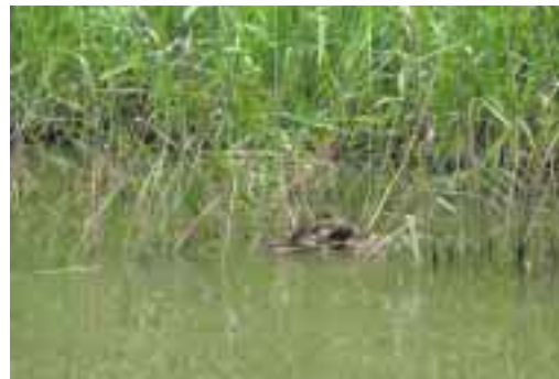
琵琶湖に生える葦

日本全国にある湖沼や河川に群生する葦は、水の汚れの原因となるリンや窒素の吸収率が高く、建材や葦簀(よしず)として利用されてきました。葦は1本で2トンの水を浄化する能力があると言われていたのですが、近年では生活環境の変化などにより、有効活用が進んでいませんでした。