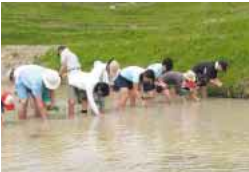
大山千枚田、田植え風景

当社では、棚田オーナー制度の導入や、社員による農作業支援などにより、大山千枚田の保存に協力しています。