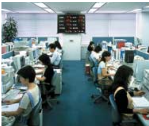
国内最大級のサポートセンター

会員制の総合サービスウェア「トータル サポート21」は、当社が1990年に業界に先駆けてハードウェアやソフトウェアの有償サポートサービスを体系化し、発展させたものです。取り扱い製品全般をカバーし、複数メーカーの製品が混在するマルチベンダー環境に対応していることが大きな特長です。なお、サポートセンターは社団法人日本オフィスオートメーション協会より「Best Helpdesk of The Year 2002奨励賞」を受賞しました。