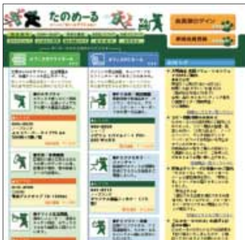
インターネットたのめーる http://www.tanomail.com/